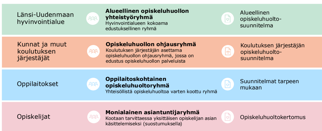
Kuva 5. Opiskeluhuollon lakisääteiset ryhmät, suunnitelmat ja asiakirjat