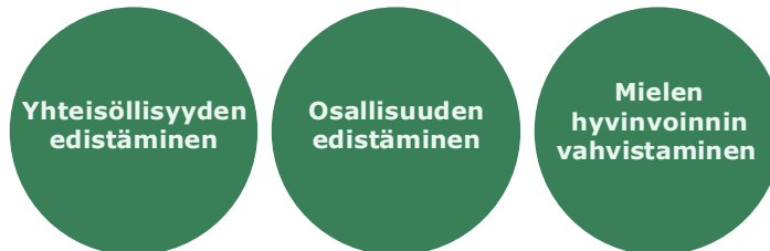
Kuva 4. Alueellisen opiskeluhoitosuunnitelman painopisteet 2027–2030

Painopisteiden toteuttamiseksi olemme asettaneet yhteistyöryhmässä seuraavia tavoitteita: