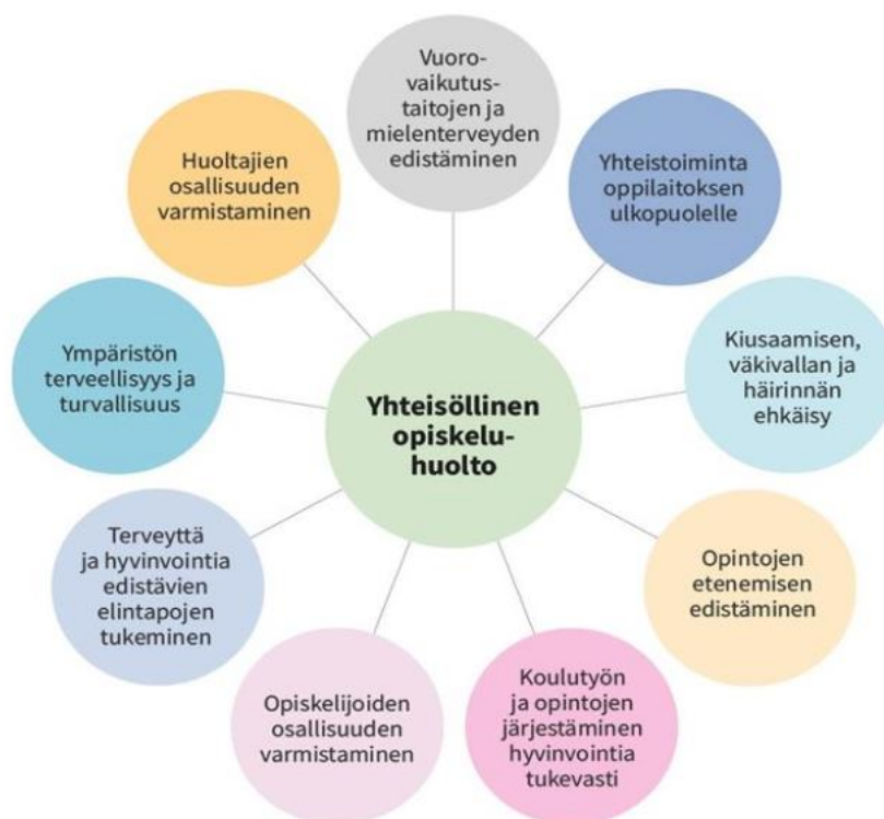
Kuva 2. Yhteisöllisen opiskeluhoiltotyön sisältöalueita (THL)

Alla olevassa kuviossa on esitettyä yhteisöllisen opiskeluhoillon sisältöalueita: