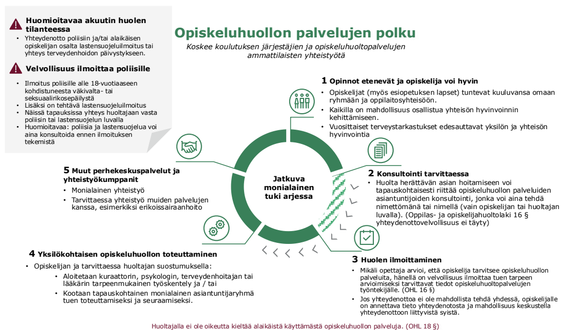
Kuva 6. Opiskeluhoollon palvelujen polku

Oppilaitoksen henkilöstön tehtävänä on ohjata opiskelija oikea-aikaisesti opiskeluhuollon palveluihin ja tarvittaessa ottaa viipymättä yhteys opiskeluhoitopalveluiden ammattilaisiin. Yhteydenotosta kerrotaan opiskelijalle ja huoltajalle lainsäädännön edellyttämällä tavalla. Alla olevassa kuviossa kuvataan opiskeluhuollon palveluiden polku, kun oppilaitoksen työntekijä havaitsee opiskelijan tuen tarpeen.