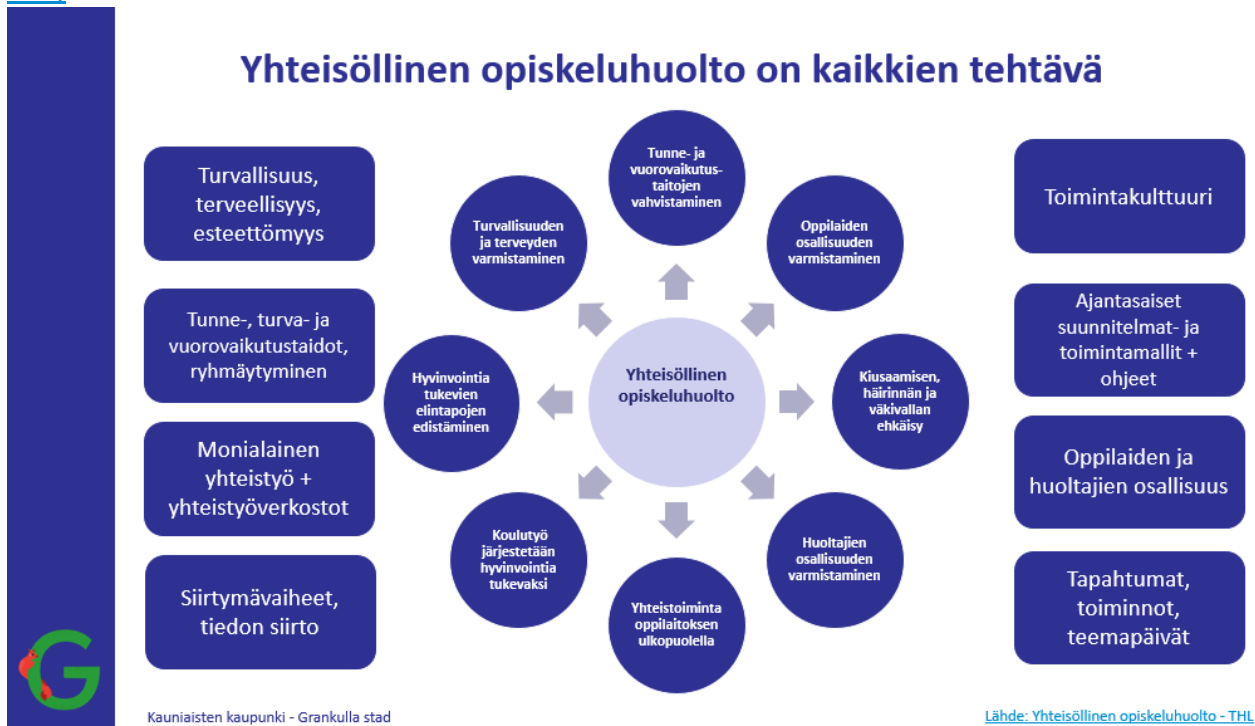
Kuva 2. Esimerkki yhteisöllisen opiskeluhoollon sisällöstä