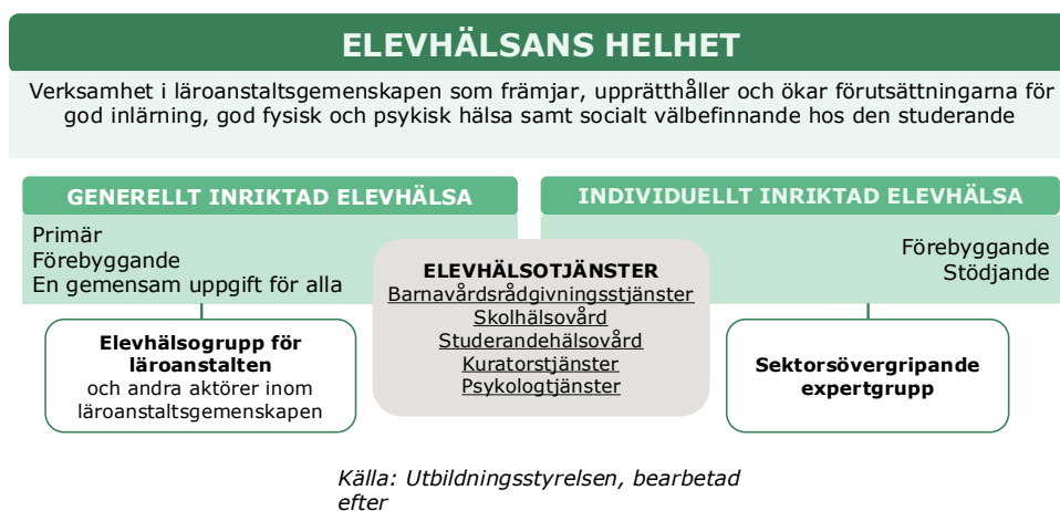
Bild 1. Elevhälsans helhet

Västra Nylands välfärdsområde ansvarar för att anordna elevhälsotjänster, men privata utbildningsanordnare kan skaffa elevhälsotjänster helt eller delvis av Västra Nylands välfärdsområde eller ordna dem självständigt. Elevhälsotjänster erbjuds i vårt område till ungefär 82 000 studerande vid totalt 430 läroanstalter (läsåret 2025–2026).