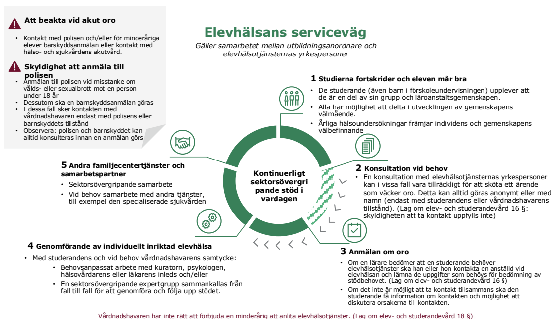
Bild 5. Elevhälsans serviceväg

Läroanstaltens personal har till uppgift att rättidigt hänvisa den studerande till elevhälsotjänster och vid behov omedelbart ta kontakt med elevhälsotjänsternas yrkespersoner. Den studerande och vårdnadshavaren informeras om kontakten på det sätt som förutsätts i lagen. Figuren nedan visar elevhälsans serviceväg när en anställd vid läroanstalten observerar studerandens stödbehov.