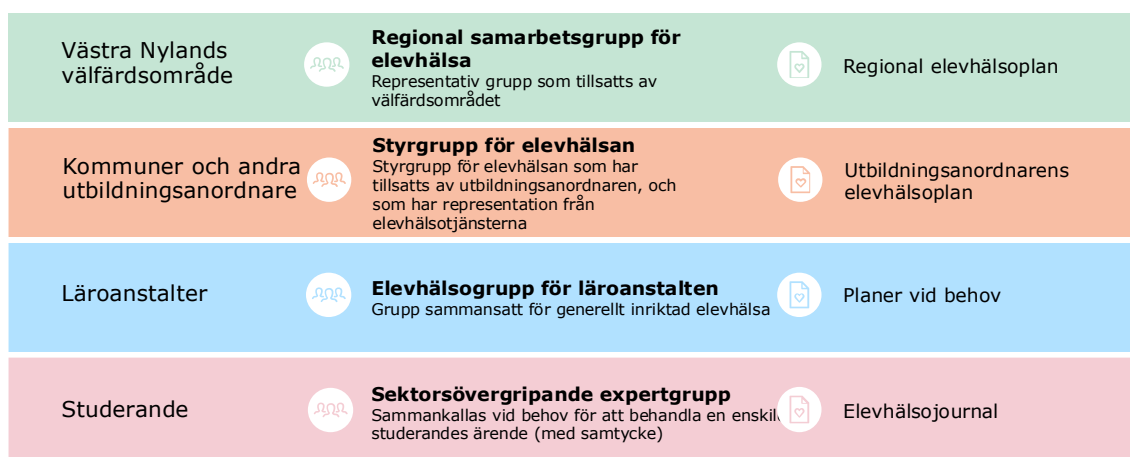
Bild 4. Elevhälsans lagstadgade grupper, planer och dokument