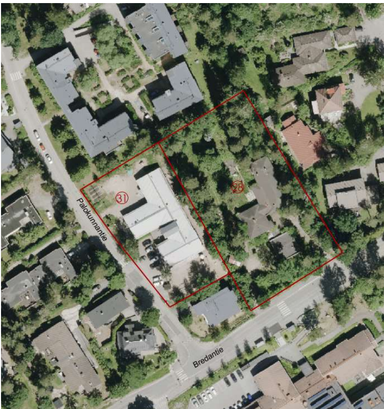
Kuva: ote ilmakuvasta (2024), tonttien 235-4-49-28 ja 235-4-49-31 sijainti, ei mittakaavassa

Kaavatontti 4-49-33 sijoittuu rakennettuun ympäristöön Kauniaisten keskustan lähistölle. Kävelyetäisyys Kauniaisten juna-asemalle on noin 1000 metriä. Kaavatontin 4-49-33 pohjoispuolella Palokunnantien varressa sijaitsee asuinkerrostaloja, paloasema ja päiväkotia. Kaavatontin 4-49-33 eteläpuolella on palvelukeskus ja kaksi kerrostaloa. Muutoin ympäristö on pientaloasutusta.