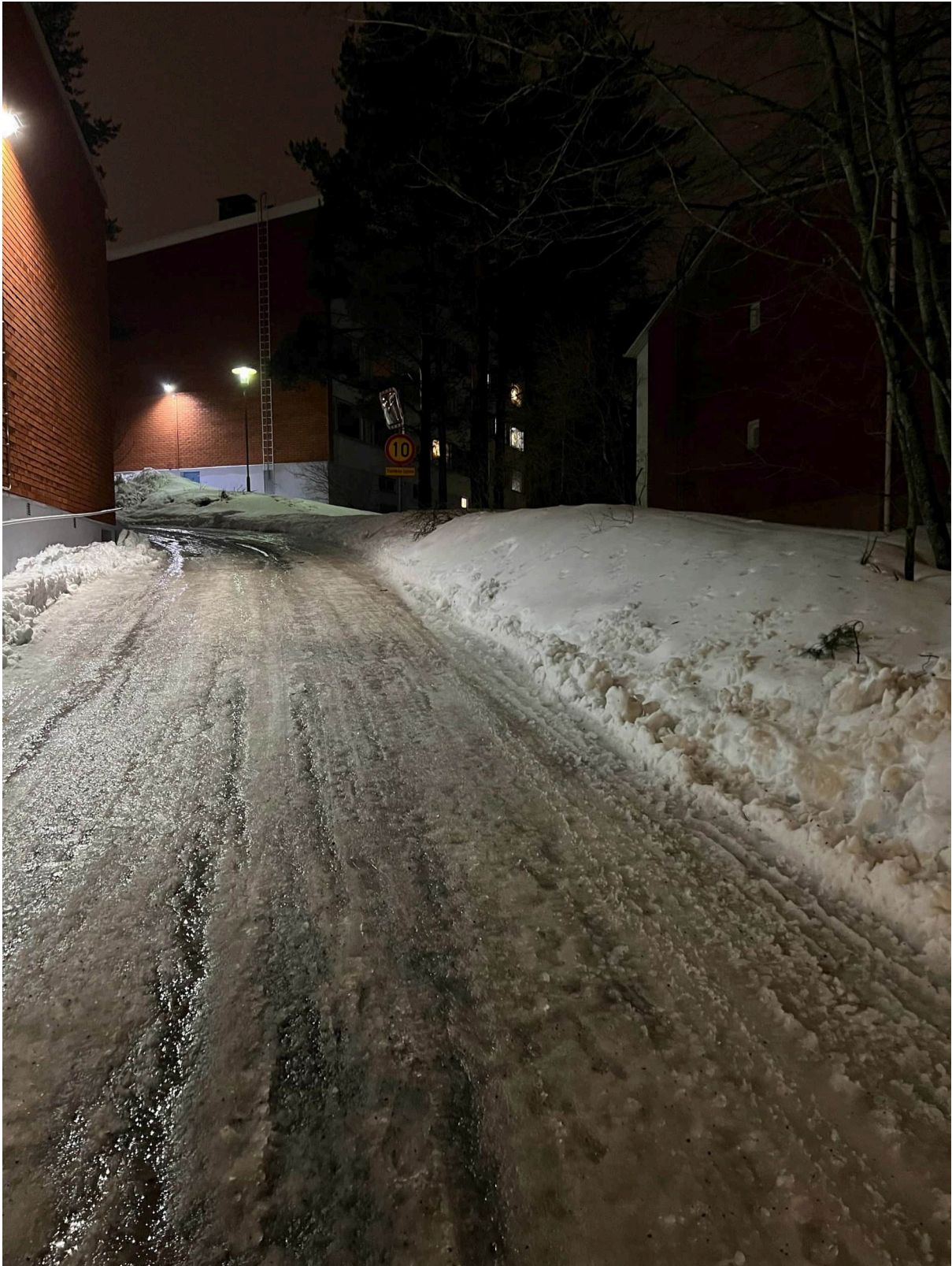
Kuva 4. Ajoluiska ja oikealla pengeri.