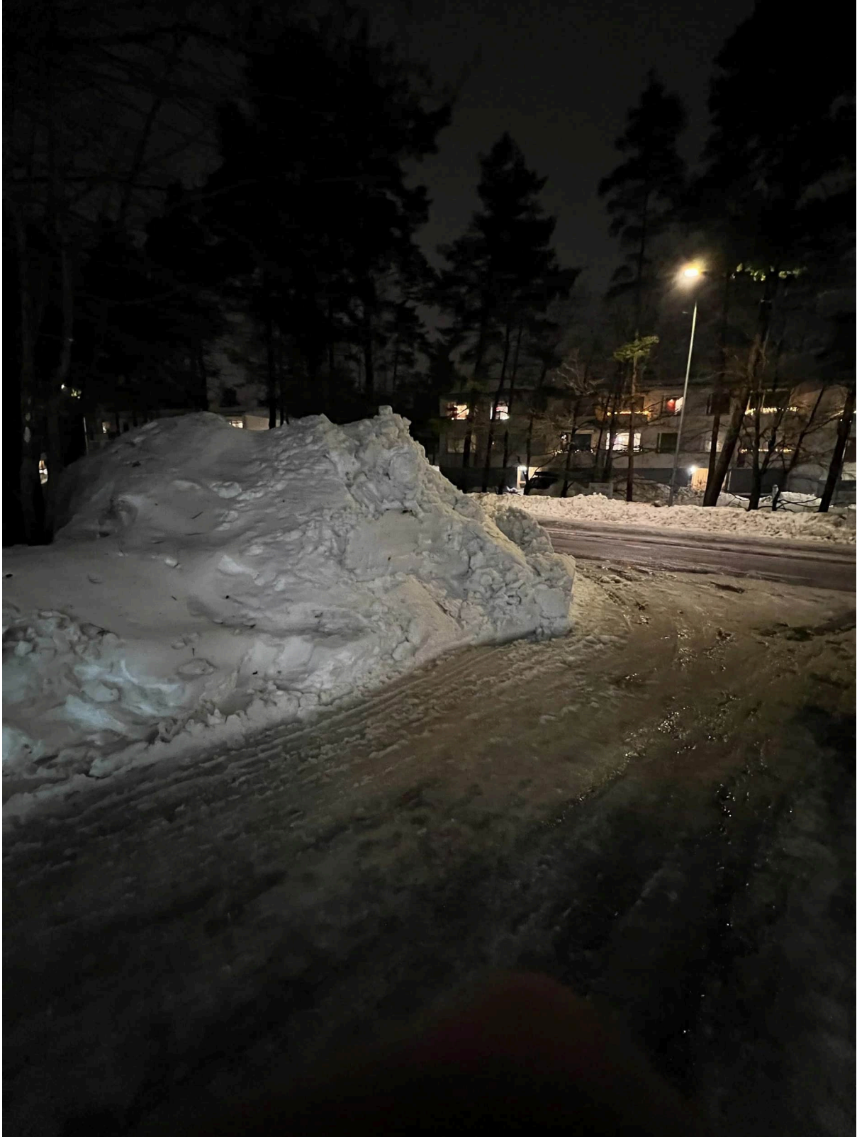
Kuva 5. Näkyvyys Urheilutielle pihalta/ajoluiskalta katsottuna kun lunta on kasattu risteykseen.