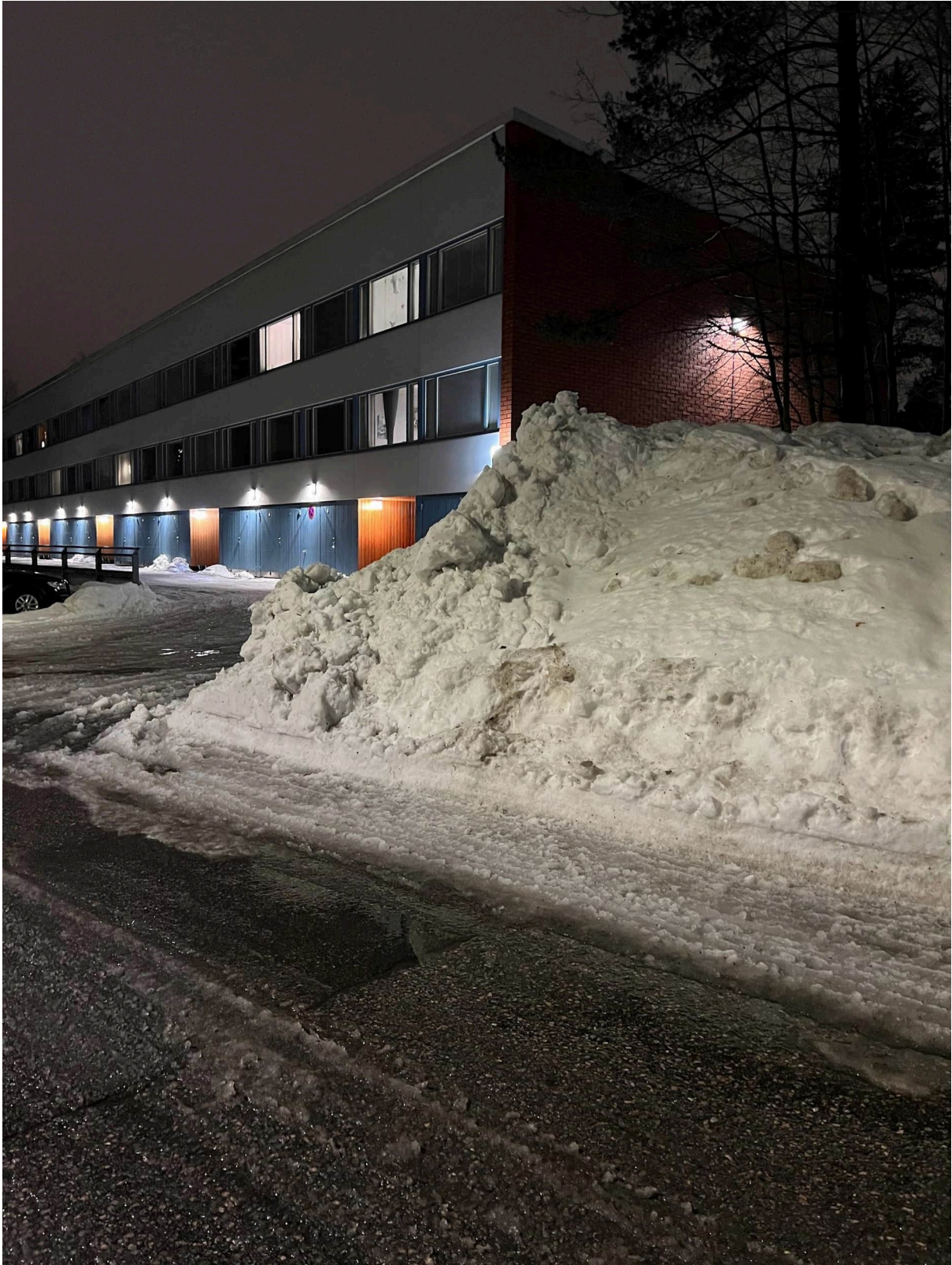
Kuva 6. Näkyvyys Urheilutieltä katsottuna.