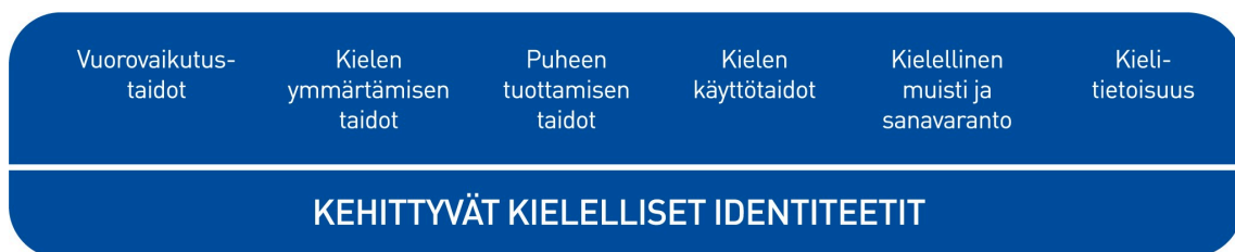
Kuvio 2. Lasten kielen kehityksen keskeiset osa-alueet varhaiskasvatuksessa

Kielen oppimisen kannalta on tärkeää tiedostaa, että saman ikäiset lapset voivat olla eri vaiheissa kielen kehityksen eri osa-alueilla. Kielelliset identiteetit kehittyvät , kun lapsia ohjataan ja tuetaan kielellisten taitojen ja valmiuksien keskeisillä osa-alueilla.