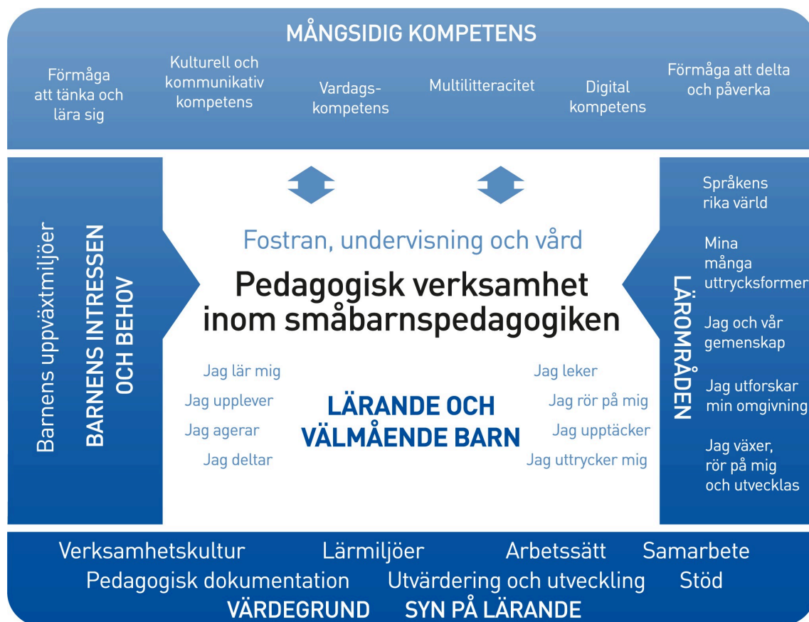
Figur 1. Referensram för den pedagogiska verksamheten

Den pedagogiska verksamheten inom småbarnspedagogiken ska präglas av ett helhetsskapande angreppssätt. Målet är att främja barnens lärande och välbefinnande samt mångsidiga kompetens (figur 1). Den pedagogiska verksamheten förverkligas i samverkan mellan barnen och personalen och i den gemensamma verksamheten. Barnens spontana verksamhet, personalens och barnens gemensamma idéer till verksamhet och verksamhet som planerats av personalen ska komplettera varandra. Den pedagogiska verksamheten inom småbarnspedagogiken ska genomsyra den helhet som består av fostran, undervisning och vård.