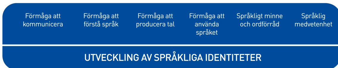
Figur 2. Språkutvecklingens centrala delområden inom småbarnspedagogiken

Med tanke på språkinläringen är det viktigt att vara medveten om att barn i samma ålder kan befina sig i olika skeden av språkutvecklingen inom olika delområden. De språkliga identiteterna utvecklas när barnen får stöd och handledning inom de centrala delområdena för språkliga kunskaper och färdigheter.