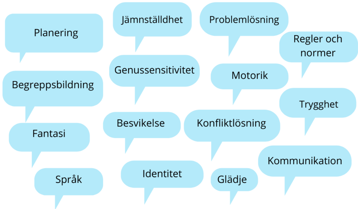
Lokalt diagram 2. Lekens betydelse