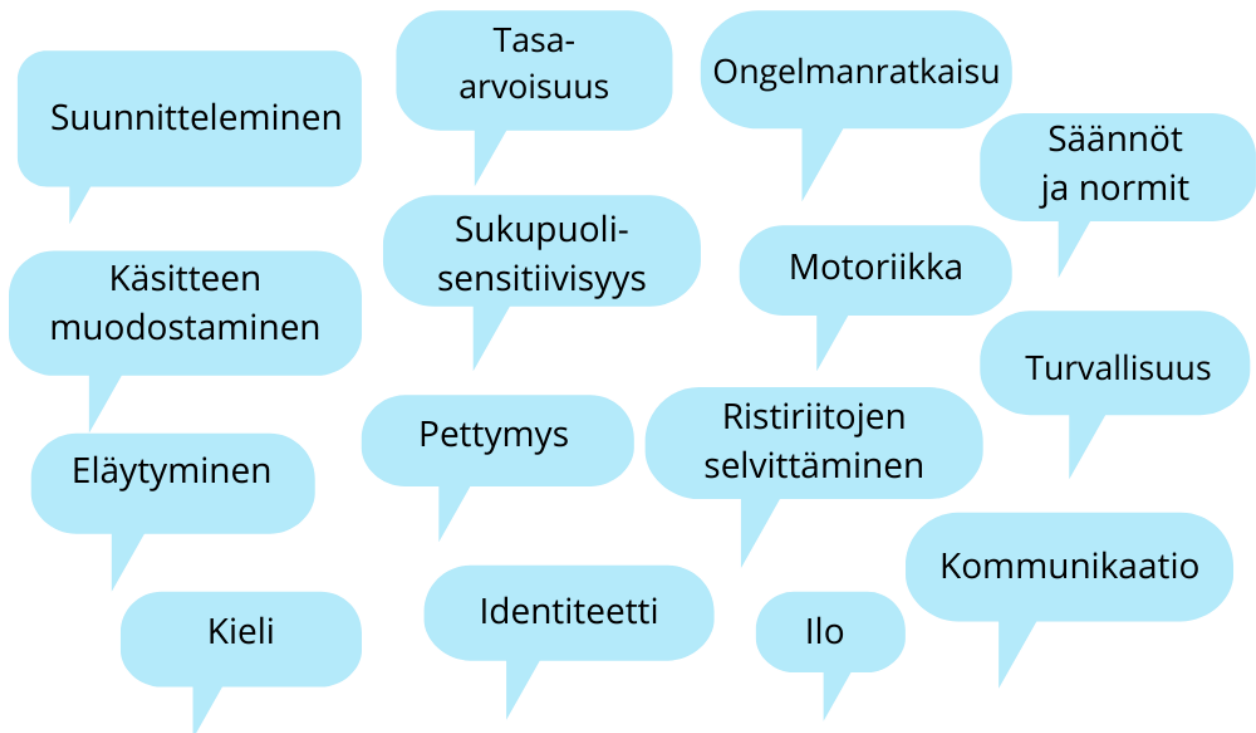
Paikallinen kuvio 2. Leikin merkitys