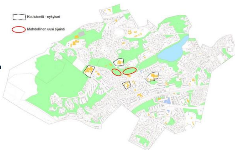
Kuva 2. Koulu- ja päiväkotiverkostotoimikunnan loppuraportti 3.6.2020, Toimikunnan esitykset kiinteistöittäin

Tarveselvityksessä on esitetty, että uuden koulurakennuksen tulisi olla vähintään viisisarjainen 600 oppilaan alakoulu ja 84 lapsen esikoulu. Esikoululaisten määrän kohdalla on huomioitava kaksivuotisen esikoulun jatko. Arviolta vuonna 2025 tehdään arviointi valtakunnallisen kaksivuotisen esiopetuksen kokeilun tuloksista ja vaikuttavuudesta, jonka jälkeen on odotettavissa päätöksiä siitä, tuleeko kaksivuotisesta esiopetuksesta pysyvä. Tästä syystä on hyvä mahdollistaa joustavia tilaratkaisuja.