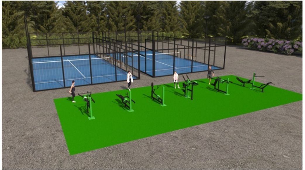
Havainnekuva padelkentistä ja ulkokuntosalista kokonaisuutena

Jos toiminnan kysyntään ei pystytä vastamaan ja tämän seurauksena päädytään jossain vaiheessa lisäämään kenttiä, tällöin Saharan kenttä toimii hyvänä vaihtoehtona. Aivan hiekkakentän kupeessa on terveysaseman pysäköintialue. Lähtökohtaisesti alue on tarkoitettu terveysaseman asiakkaiden käyttöön, mutta terveysasema sulkee klo 16, jolloin parkkipaikat vapautuvat muiden käyttöön.