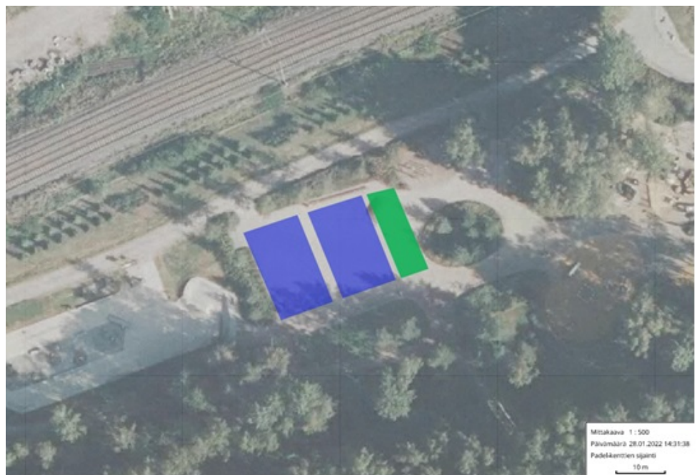
Padelkenttien sijoitus Thurmaninpuiston hiekkakentälle sinisellä (vihreällä ulkokuntosali)

Liikuntapalvelut on kartoittanut yhteistyössä maankäytön kanssa sopivinta sijoituspaikkaa. Soveltuvin alue osoittautuu olevan Thurmaninpuiston hiekkakentälle. Kyseisellä hiekkakentällä ei tällä hetkellä ole toimintaa. Aivan Thurmaninpuiston hiekkakentän läheisyydessä sijaitsee vapaassa käytössä, klo 08-20, 2h rajoitteilla olevia parkkipaikkoja, mitkä palvelisivat myös autolla padelkentille saapuvia kuntalaisia.