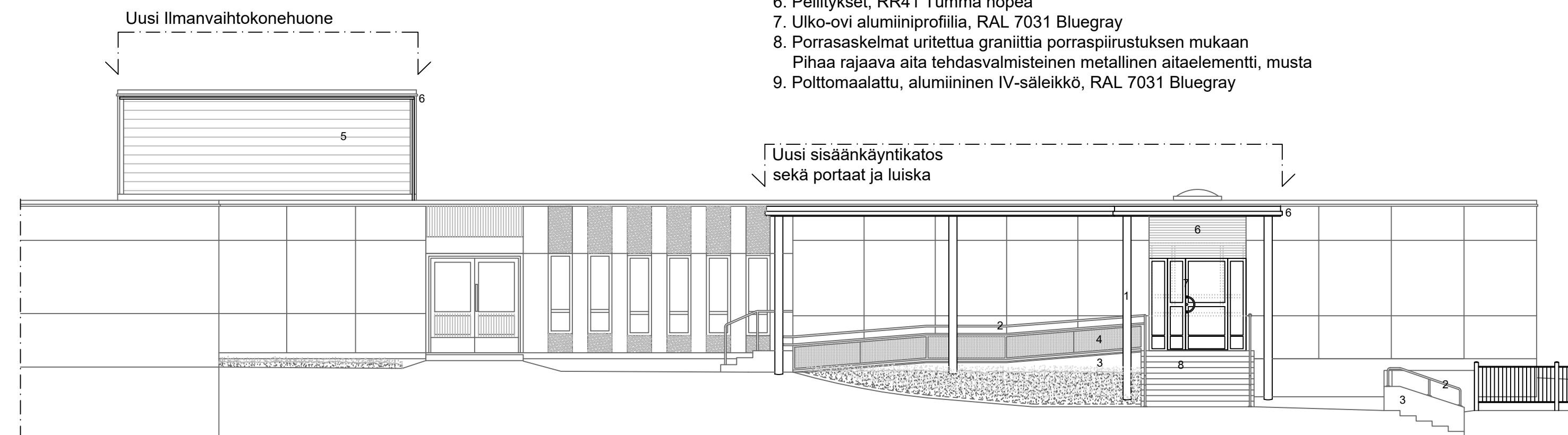
Julkisivu etelään 1:100